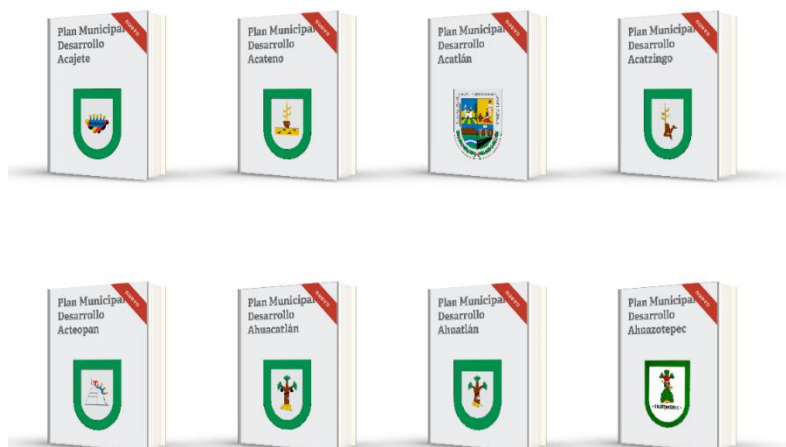
Imagen 2. Publicación de PMD